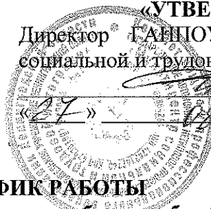
ГРАФИК РАБОТЫ приемной комиссии на сентябрь-декабрь 2020 года (в составе профдиагностической подкомиссии)

02 сентября 2020 г. с 10.00 до 15.00; 09 сентября 2020 г. с 10.00 до 15.00; 16 сентября 2020 г. с 10.00 до 15.00; 23 сентября 2020 г. с 10.00 до 15.00; 30 сентября 2020 г. с 10.00 до 15.00; 07 октября 2020 г. с 10.00 до 15.00; 21 октября 2020 г. с 10.00 до 15.00; 11 ноября 2020 г. с 10.00 до 15.00; 25 ноября 2020 г. с 10.00 до 15.00; 09 декабря 2020 г. с 10.00 до 15.00; 23 декабря 2020 г. с 10.00 до 15.00.